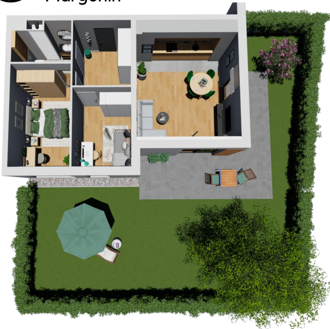
Przykładowa aranżacja mieszkania

mieszkanie 3 pokojowe z ogrodem, na parterze w budynku A.